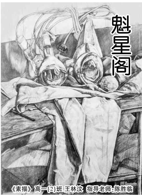
《素描》高一(2)班 王林汶 指导老师：陈胜临

或许是门没有关紧，一阵寒风吹了进来，老李打了个寒颤，电话那头早已没有了声音，他还是维持着打电话的动作。儿子刚才的话就像一盆冷水泼在他头上一样，他眼神空洞，放下电话，一步一步地走去厨房，下了一盘饺子，坐在饭桌前，桌上是他摆