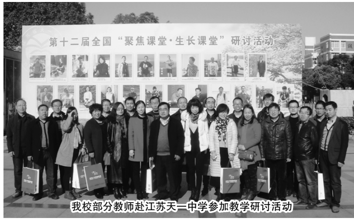
我校部分教师赴江苏天一中学参加教学研讨活动