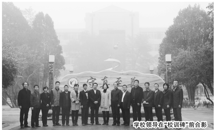
学校领导在“校训碑”前合影