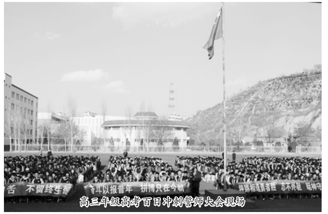
高三年级高考百日冲刺誓师大会现场