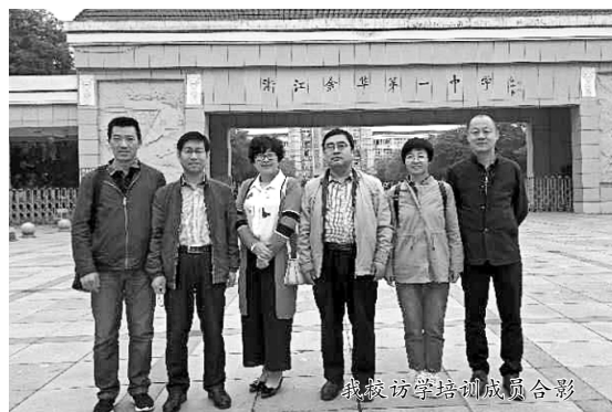
我校访学培训成员合影

浙江省新高考的选课模式是“七选三”,即从物理、化学、生物、历史、地理、政治以及技术(由通用技术和信息技术合成)中选三门,所选三门和语数外构成高考科目。学生所选科目肯定会有至少两门学科雷同的学生,学校就将这些有两门课雷同的学生编成一个班,剩下的学生走班,即“合并同类项”,以此类推,所有的学生都有固定的班级,也都要走班。所以,学生的课表设置有固定的走班课。