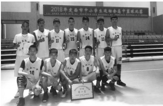
5月24日至28日，定西市中小学生运动会高中篮球比赛在漳县体育馆隆重举行，来自全市各县区普通高中

的代表队展开激烈角逐，我校男篮充分发挥敢打敢拼、不畏强敌的精神，一路过关斩将，顺利通过小组赛、淘汰赛、半决赛，最后在与东方红中学的决赛中，以绝对优势大比分领先，勇夺冠军，成功卫冕。