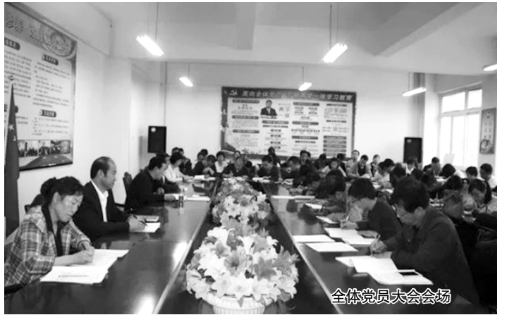
全体党员大会会场