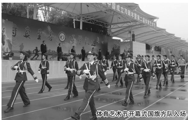
体育艺术节开幕式国旗方队入场