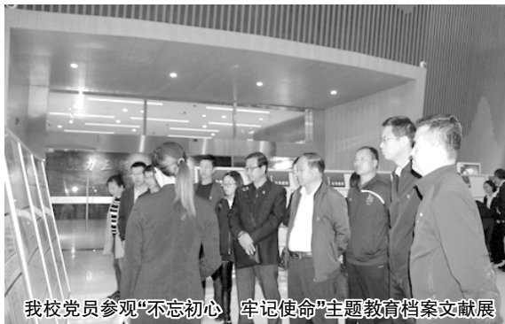
我校党员参观“不忘初心、牢记使命”主题教育档案文献展

展共分为五个部分,包括理论探索、理想信念、不懈奋斗、牢记宗旨、自身建设。这些珍贵的档案文献,生动再现了中国共产党带领全国人民进行革命斗争的光辉历程,充分展示了中国共产党人自力更生、艰苦奋斗的革命精神和舍家为国、舍生取义的崇高品质。