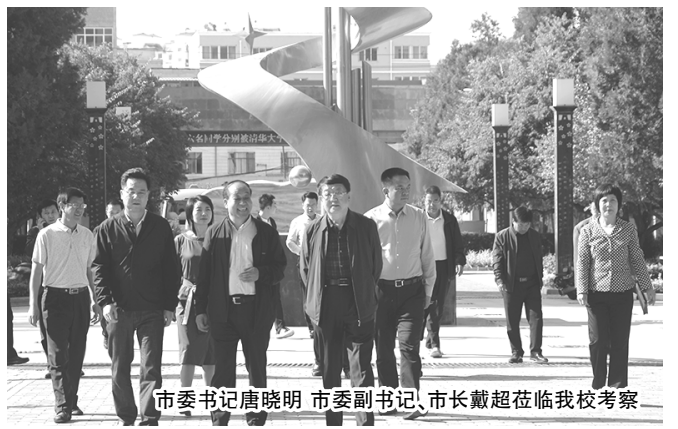
市委书记唐晓明 市委副书记、市长戴超莅临我校考察